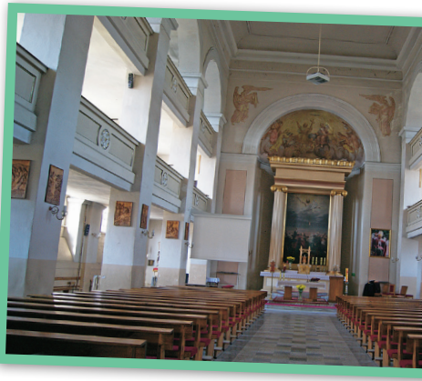
Wnętrze kościoła protestanckiego, jednej z dwóch wolsztyńskich świątyń